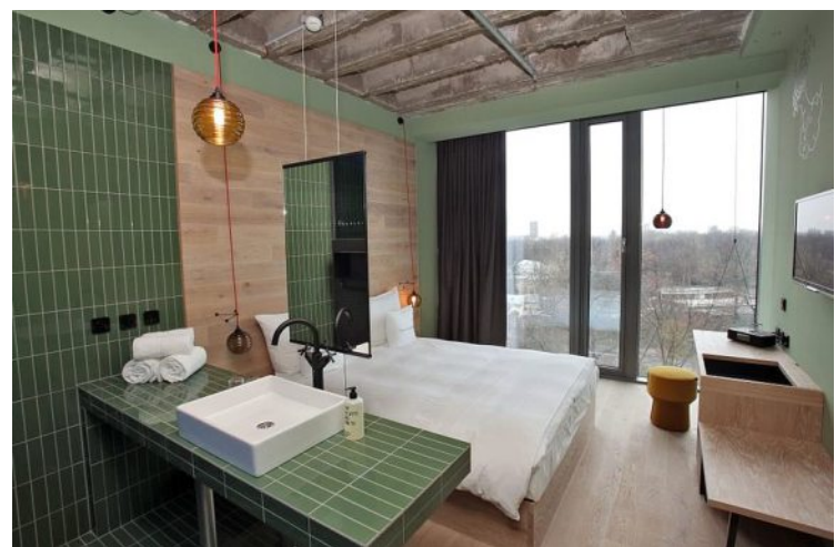
Zimmer mit Berlin-Design Für die letzten Details bei der Einrichtung der Räume zeichnet die Berliner Sybille Oellerich verantwortlich