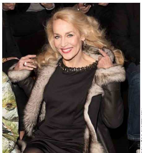
Fashion-Ikone Das US-amerikanische Model Jerry Hall bei der P&C-Schau