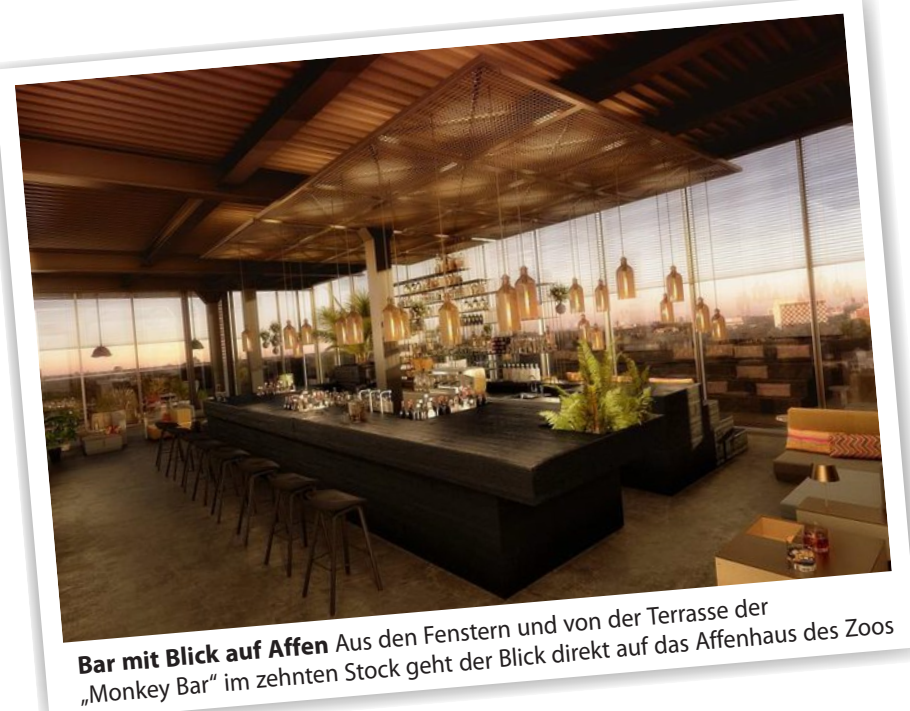
Bar mit Blick auf Affen Aus den Fenstern und von der Terrasse der „Monkey Bar“ im zehnten Stock geht der Blick direkt auf das Affenhaus des Zoos

„Da unten, der Schimpanse, das war eigentlich unser Namensgeber“, sagt Hoffmann, der mit Aisslinger und Rebbe in den zehnten Stock zur „Monkey Bar“ gefahren ist und auf der Dachterrasse steht. Die im Sommer durch das Öffnen aller Fenster erweitert werden kann, wie Hoffmann sagt, und von einem DJ-Pult mit Schallplatten von der Decke sowie offenem Kamin und Sitzbänken in Am-