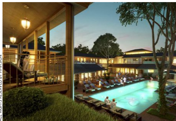
Die Anlage Auf der Simulation (I) ist der Außenpool inklusive zwei-stöckiger Hausanlage zu erkennen